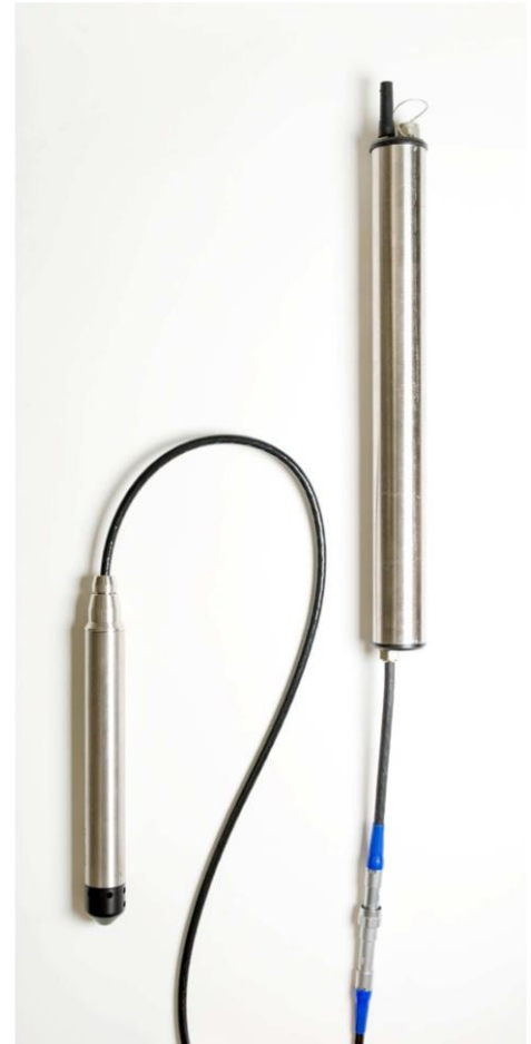
GW Datensammler mit GSM Modul